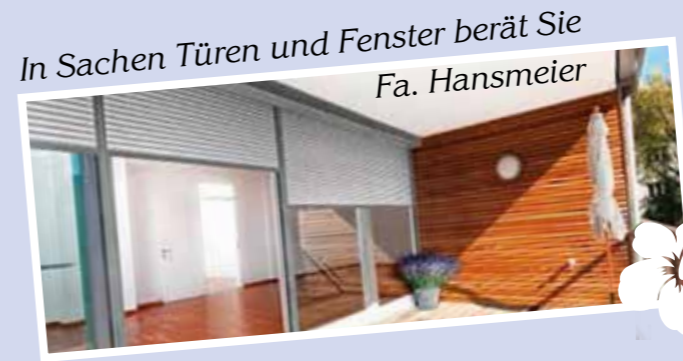
In Sachen Türen und Fenster berät Sie Fa. Hansmeier

Der Jagdverein präsentiert das Fauna Mobil und bietet eine Verlosung an.