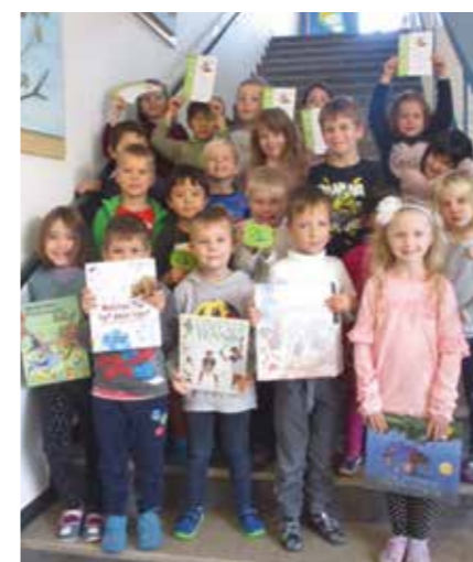
Marktler Vorschulkindergartenkinder mit ausgeliehenen Büchern und den erhaltenen Urkunden