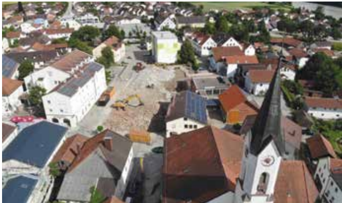
Das Luftbild zeigt die große Abbruchstelle in der Poststraße

Seit 1852 prägte der alte „Gasthof zur Post“ den Marktler Marktplatz. Der Zahn der Zeit hat immer mehr am „Straßer“, wie der Gasthof auch genannt wurde, genagt. Da aber eine wirtschaftlich sinnvolle Nutzung schon seit vielen Jahren nicht mehr möglich war, verfiel das Gebäude. Jetzt konnte der „Straßer“ zusammen mit dem leerstehenden Anbau des ehemaligen Edeka-Marktes abgerissen werden. Die geplante Neubebauung des Areals wird Markt sicherlich wieder aufwerten.