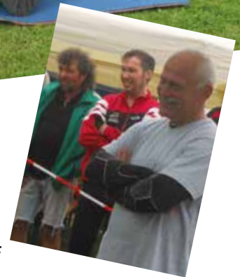
Text und Fotos: Elke Pleininger