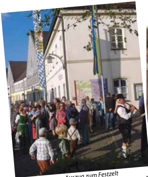
Auszug zum Festzelt

Tischreservierungen möglich unter Tel. 0163/8514345