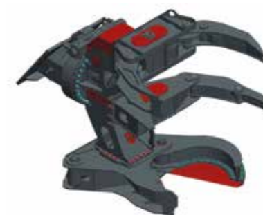
Holzgreifer WT mit optional erhältlichem Mittelgreifer